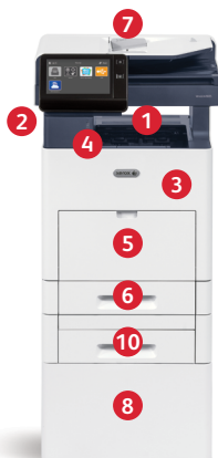
Equipo multifunción color Xerox® VersaLink® C605 Imprime. Copia. Escanea. Fax. Correo electrónico. Conectividad móvil.