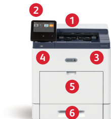
Impresora de color Xerox® VersaLink® C600 Imprime. Conectividad móvil.