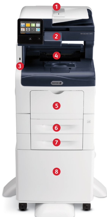
Equipo multifunción color Xerox ® VersaLink ® C405 Imprime. Copia. Escanea. Fax. Correo electrónico.