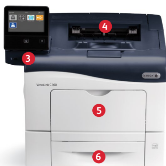
Impresora color Xerox ® VersaLink ® C400 Imprime.

1 Los puertos USB se pueden desactivar. 2 Solo VersaLink ® C405.